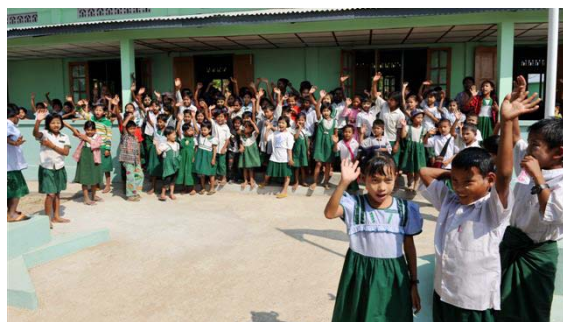
別れを惜しむ子供たち