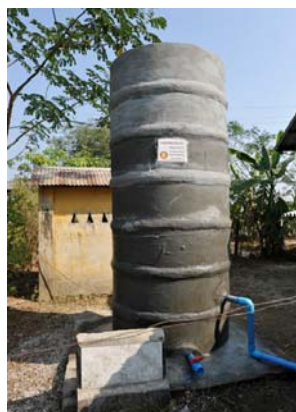
きれいに整備された 水道タンク