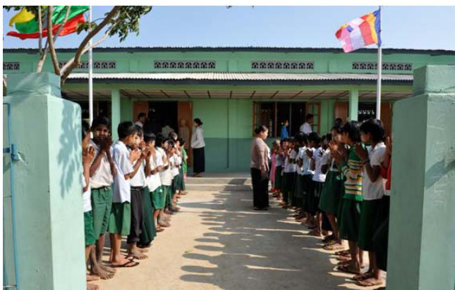
ダーベン村小学校生徒が校門前に整列 「ありがとう！ありがとう！」を言いつづけて