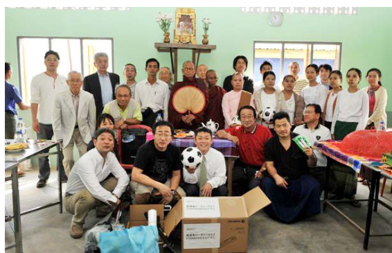
船橋東 RC 訪問会員とプレゼントの品々