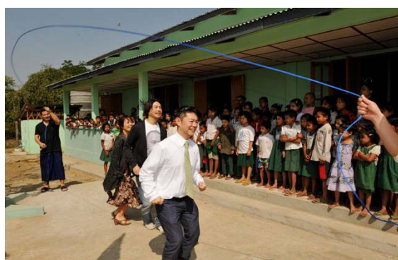
持参した「大縄跳び」を実演する会員たち