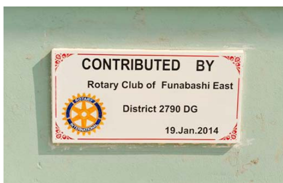
今回作り直した看板