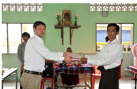
贈呈式 藤代会長より