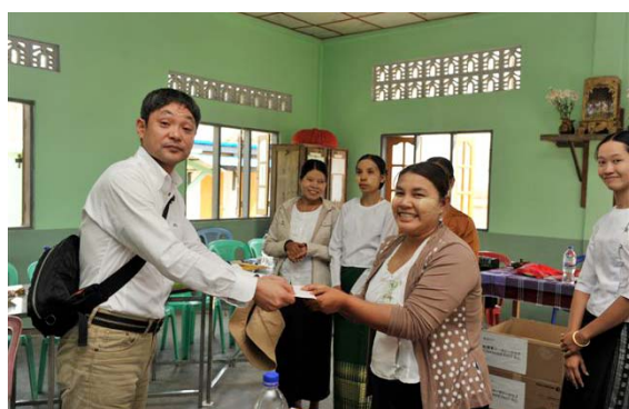
小学校の先生たちに小遣いのプレゼント