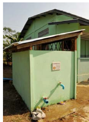
水道のモーター小屋